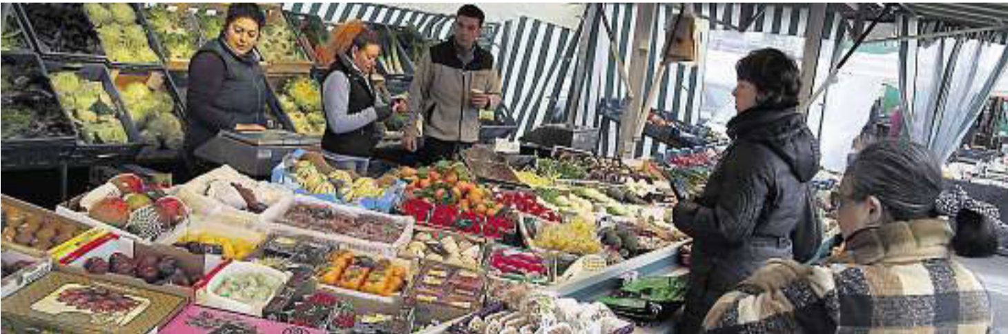
Rund 100 Verkaufsstände locken die Besucher

Am 17. März geht’s los: Deko, Essen, Blumen und vieles mehr