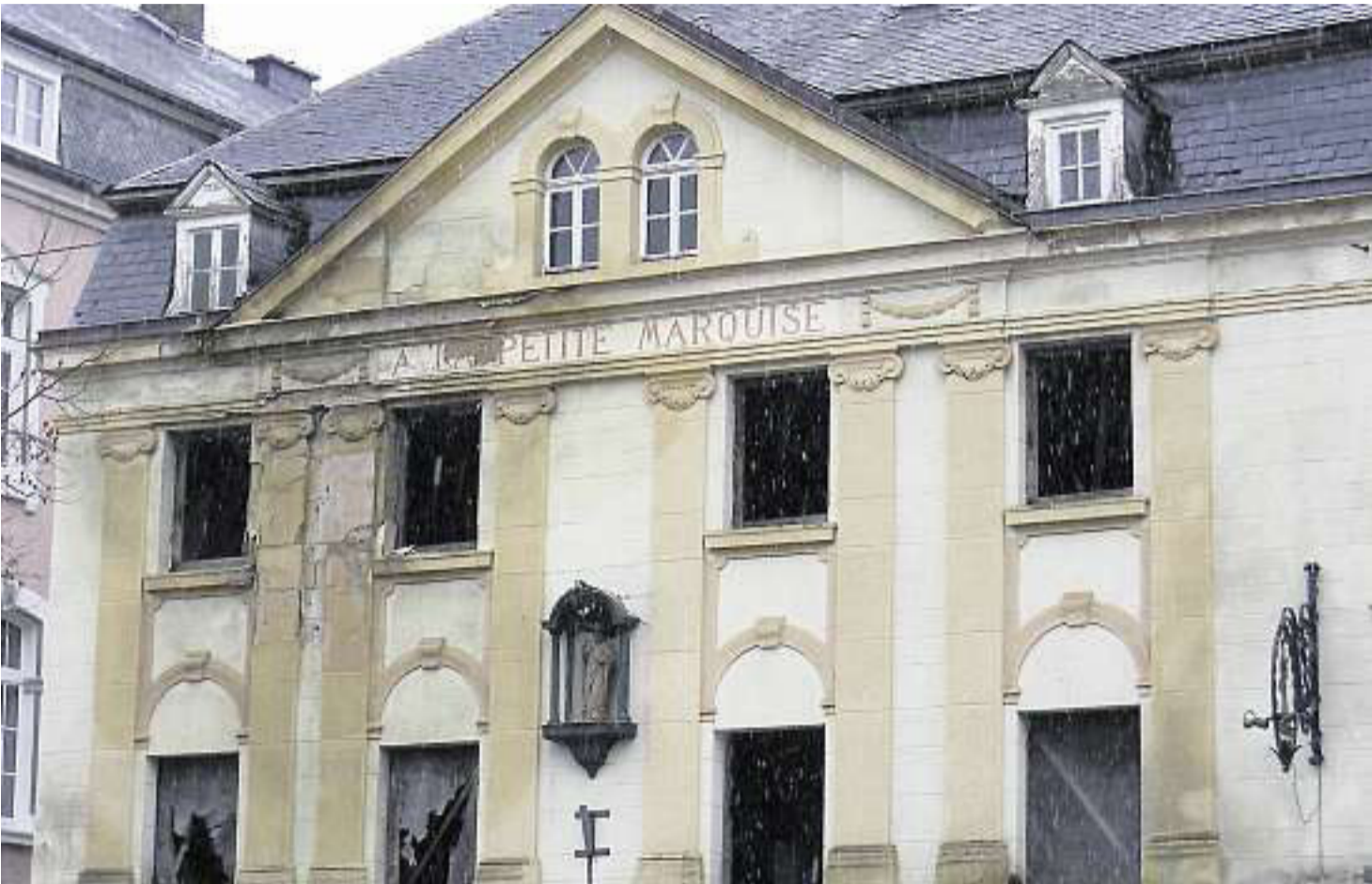
Noch ein Schandfleck, doch dies soll sich ändern: La Petite Marquise

Marktplatz Echternach soll wieder „gute Stube der Stadt“ werden